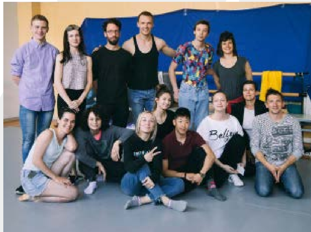
Rencontre des équipes russes et françaises à l'ICC (Innovative Cultural Center)

Le séminaire a rassemblé plus de 40 participants, regroupant danseurs et chorégraphes de Kalouga et de Moscou, metteur en scène de Kalouga, photographes et journalistes de Kalouga, Moscou et Saint-Pétersbourg et producteurs de danse de Moscou.