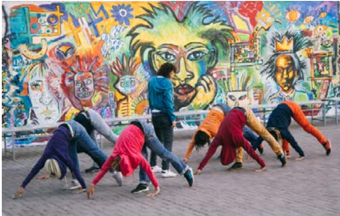
Représentation de la version franco-russe de Génération [Pomm]ée - Festival Tsiolkovsky 2019