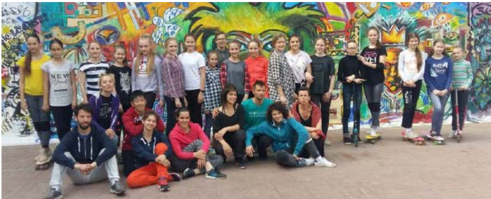
Innovative Cultural Center (ICC) de Kaluga