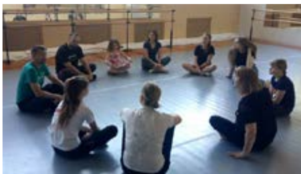
Danse en famille - ICC Kalouga 2019